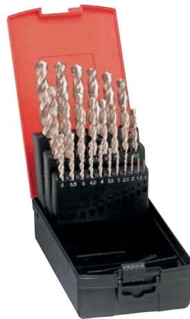
1033 pulido format professional quality