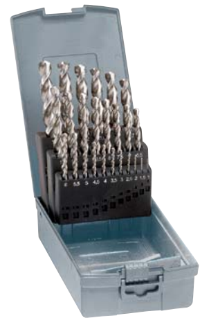
1026 pulido GUHRING