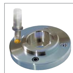
Avellanado, (conforme a DIN 74)