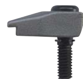
Garra de sujeción