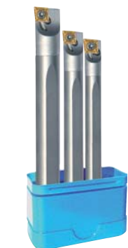
Fig.: Versión a la derecha Suministro sin plaquitas de corte.