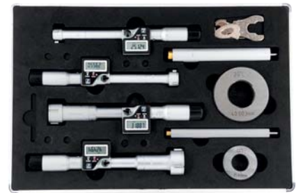
4190 2050 format professional quality