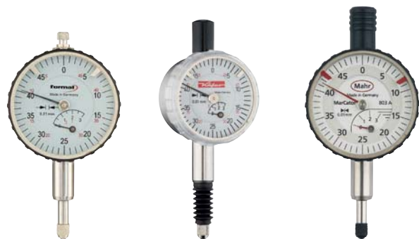
4218 format professional quality