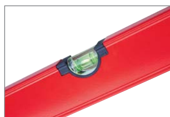
Carcasa de burbujas redondeada para una lectura segura.