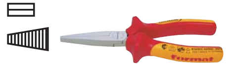
5166 format professional quality