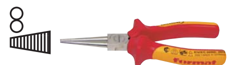
5180 format professional quality