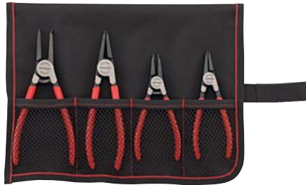
5616 0010 format professional quality