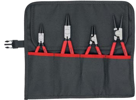
5606 0020 KNIPEX