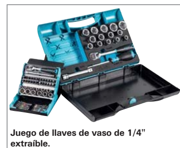
Juego de llaves de vaso de 1/4" extraíble.