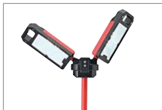
Luz fría (7000 K).