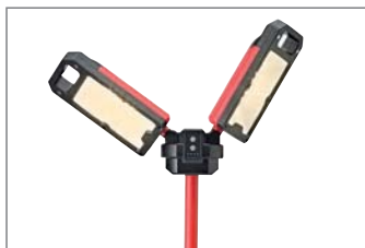
Luz cálida (4000 K).