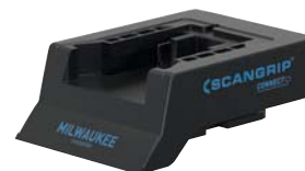
Adaptador de interfaz