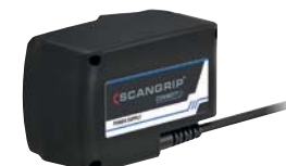
Conexión a la red