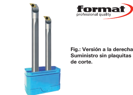
Fig.: Versión a la derecha Suministro sin plaquitas de corte.

Δ Solo es posible la entrega de una unidad de embalaje completa. (W105) (W113) (W113)