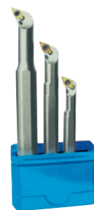
Fig.: Versión a la derecha Suministro sin plaquitas de corte.