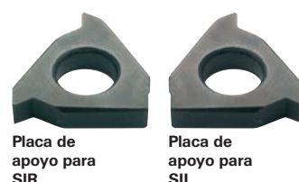
Placa de apoyo para SIR

Nota: lotras placas de apoyo con otros ángulos de inclinación disponibles a petición.