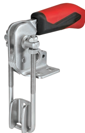
Tabla de medidas