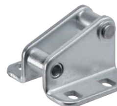
Tabla de medidas