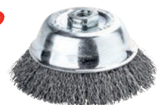
7986 LESSMANN THE GERMAN BRUSH COMPANY