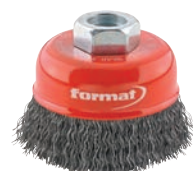
7032 format professional quality