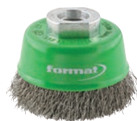
7034 format professional quality