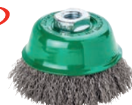
7987 + 7985 LESSMANN THE GERMAN BRUSH COMPANY