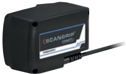
Conexión a la red