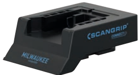
Adaptador de interfaz Conector