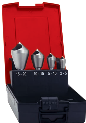
HSS 1427 0001&1427 0005 pulido