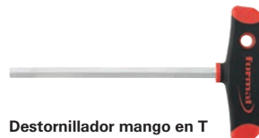
Destornillador mango en T