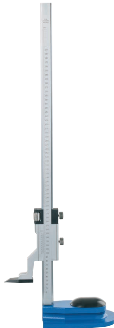
4443 format professional quality