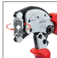
Cabeza giratoria 360° con 8 posiciones de muesca.