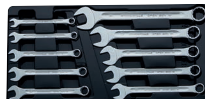
5926 1000 STAHLWILLE