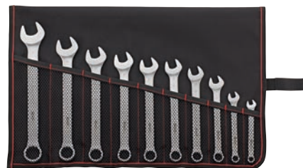
5726 0017 format professional quality

5926 De acero de aleación de cromo, cromado. Vástago estable con doble perfil T.