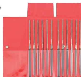
6647 format professional quality