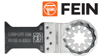
Form 160 STARLOCK