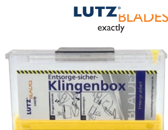
LUZT BLADES exactly