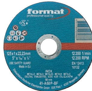
8085 format professional quality