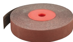
8150 + 8153 format professional quality