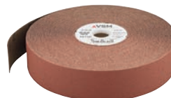
8151 + 8154 VSM