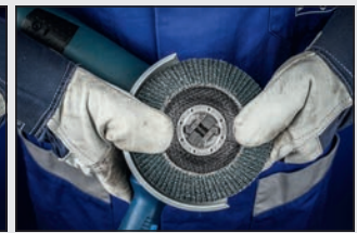
Presionar hasta hacer clic