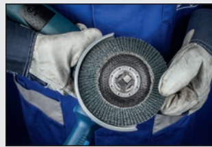
Centrado del disco

Encontrará amoladoras angulares compatibles con el alojamiento X-LOCK en nuestro catálogo de herramientas electrónico.